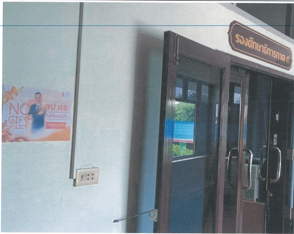
รูปภาพรณรงค์การดำเนินการตามนโยบาย No Gift Policy